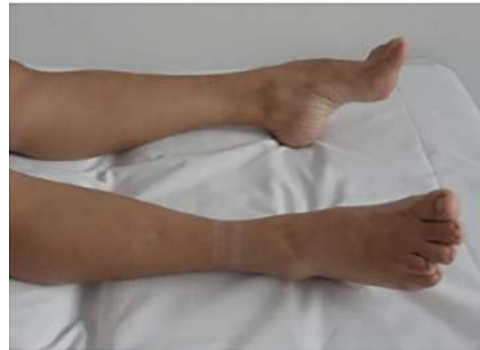
Figura 1. Pie cavo

ser catalogados según el tipo de herencia como dominantes o recesivos.